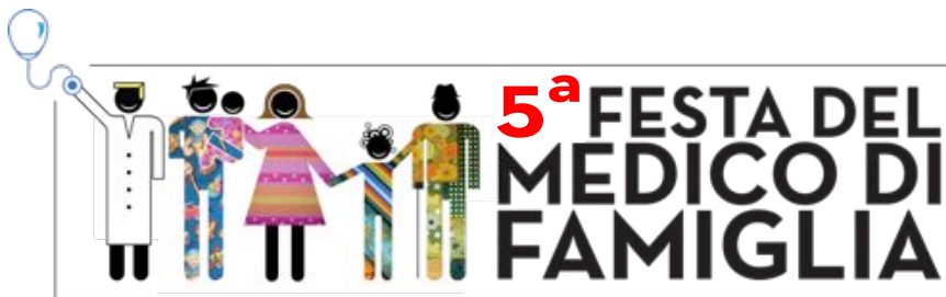
TAVOLA ROTONDA: RAZIONALIZZARE LA SPESA FARMACEUTICA.