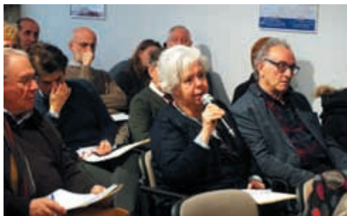
Il momento del microfono aperto

«Così – ha proseguito – ho deciso che avrei