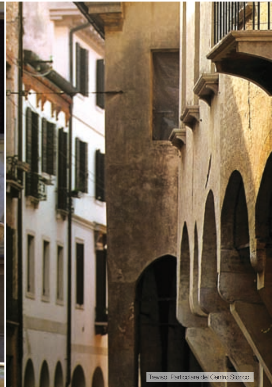
Treviso. Particolare del Centro Storico.