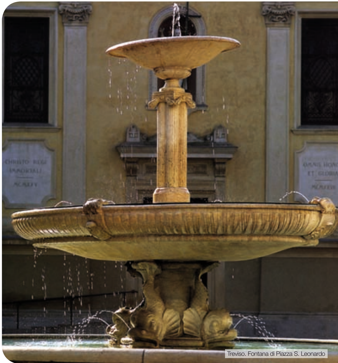
Treviso. Fontana di Piazza S. Leonardo